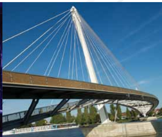
La passerelle Mimram, au Jardin des Deux Rives