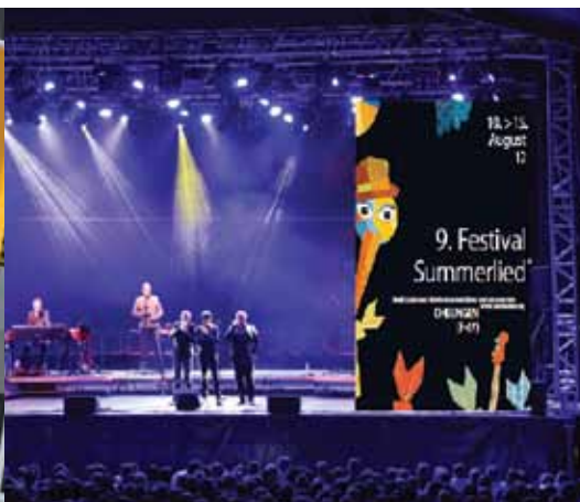
1 Muvrimi à l'édition 2012 du festival transfrontalier Summerlied