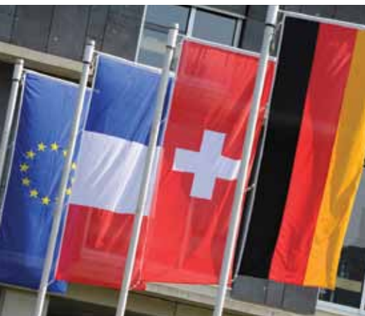
Le Rhin Supérieur, territoire de coopération tri-nationale